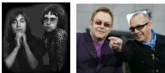
Elton John & Bernie Taupin