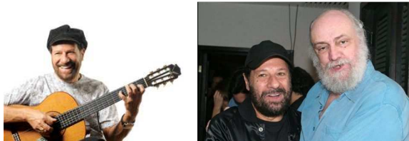
Joao bosco et Aldir Blanc

Au diable ! L'espoir équilibriste Sait que le spectacle de tout artiste Doit continuer