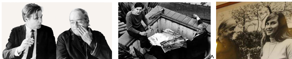
Tom Jobim & Vinicius de Moraes / Helo Pinheiro

À la base, Vinicius de Moraes fit une version différente de cette chanson, ayant pour nom Menina que Passa (la jeune fille qui passe). Elle avait été composée pour une comédie musicale, Dirigível (Blimp), sur laquelle Tom et Vinicius travaillaient. Mais aucun des deux auteurs n'était satisfait de cette version. Le texte définitif de la chanson aurait été inspiré par une jeune fille de 19 ans, Heloísa Eneida Menezes Paes Pinto, plus connue sous le nom de Helo Pinheiro, qui vivait à Ipanema. Elle passait chaque jour, pour aller à la plage, devant le bar Veloso (aujourd'hui nommé "Garota de Ipanema") dont Tom et Vinicius étaient des habitués.