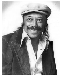
Panonica & Horace Silver